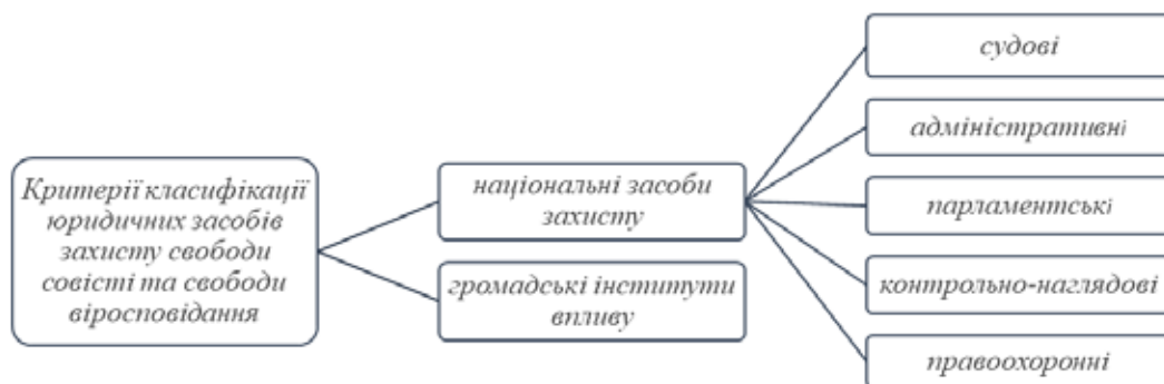
Рис. 3. Критерії класифікації юридичних засобів захисту свободи совісті та свободи віросповідання [12, с. 188]

та захисту як свободи совісті та свободи віросповідання загалом, так і окремих її елементів (можливостей), закріплених у правових нормах конкретної держави.