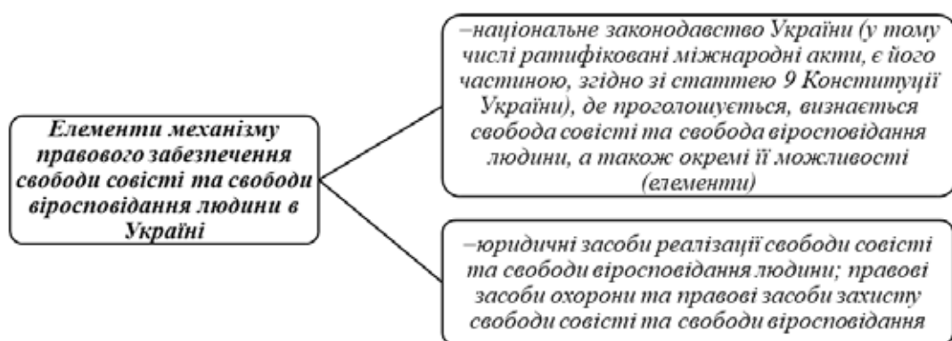
Рис. 2. Елементи механізму правового забезпечення свободи совісті та свободи віросповідання людини в Україні [8, с. 41]

Отже, механізм захисту свободи совісті та свободи віросповідання людини – це система ефективних правових засобів реалізації, охорони